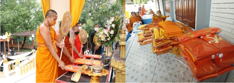
ภาพที่ 2 การถวายผ้าบังสุกุลจิรกับความเชื่อหลังความตาย

10. เครื่องสองสว่าง เช่น ตะเกียง หลอดไฟฟ้า ไฟฉาย เป็นต้น