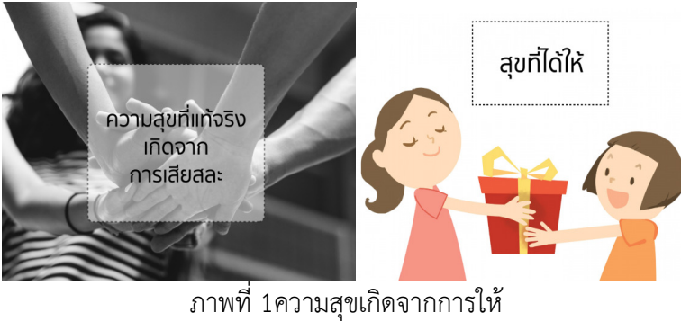
ภาพที่ 1 ความสุขเกิดจากการให้