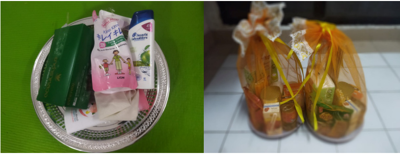
ภาพที่ 4 รูปแบบผลิตภัณฑ์สังฆทานสำเร็จรูป

การนำผ้าเก่าเหลือใช้ ผ้าห่อศพที่ผู้คนไม่ใช้แล้วมาใช้เป็นจิวรนุ่งหม่มสำหรับภิกษุศากยะ ถือว่าเป็นการนำของเหลือ หรือของที่เป็นขยะนำมาสร้างมูลค่าเพิ่ม (Value Added) เป็นของสูงสำหรับพุทธศาสนิกชนที่ควรเคารพและบูชา เมื่อใช้งานเก่าหรือขาดวินไม่สามารถนุ่งหม่มได้แล้วก็สามารถนำไปใช้ประโยชน์อย่างอื่น เป็นการไม่ทำให้สิ่งของนั้นเกิดต้นทุนค่าเสียโอกาส (Opportunity Cost) จิวรในสมัยพุทธกาลจึงถือได้ว่าเป็นของที่ไม่เข้าข่ายเป็นต้นทุนจม (Sunk Cost) สามารถนำไปต่อยอดทำประโยชน์อย่างอื่นได้มากมาย ไม่มีความเสี่ยงต่อการลงทุน (การเดินทางไปบังสกุลผ้าห่อศพในป่าช้า) ไม่มีความผิดพลาดระหว่างดำเนินการ (สละจิวรผืนนั้นให้ภิกษุรูปอื่นได้) ไม่เสียโอกาสที่จะได้รับสิ่งตอบแทนจากการใช้จิวรนั้น (การนำไปใช้ประโยชน์อย่างอื่น เช่น ผ้าปูนอน ผ้าปูพื้น ผ้าเช็ดเท้า และผสมดินเหนียวฉาบฝาบ้าน) การถวายจิวรและถังสังฆทานในยุคปัจจุบันที่ชาวพุทธมีความเชื่อเรื่องบุญ ถวายแต่พระสงฆ์แล้วจะได้ขึ้นสวรรค์ ได้ไปในภพภูมิที่ดีเมื่อลาจากโลกนี้ไปแล้ว จึงเกิดธรรมเนียมปฏิบัติ จิวรและถังสังฆทานเป็นสิ่งของที่ใช้แล้วไม่หมดไป สามารถนำมาใช้ซ้ำอีก ผ้าเก่าสีกก็นำไปย้อม มี