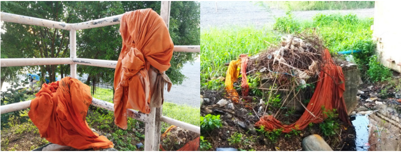
ภาพที่ 3 จีวรเก่าที่กลายเป็นขยะบุญญ

พระพุทธเจ้าทรงเป็นผู้ที่ใช้ทรัพยากรที่มีอยู่อย่างจำกัดให้เกิดประโยชน์สูงสุดตามคำนิยามทางเศรษฐศาสตร์ โดยพระองค์ทรงอนุญาตให้ภิกษุใช้ผ้าถุงตามที่จะหามาได้ หรือเก็บเอาผ้าที่เขาทิ้งไว้ตามที่ต่างๆ บ้าง มีคนเขามาถวายบ้าง และบางทีก็เป็นผ้าห่อศพบ้าง (พระไตรปิฎกภาษาไทย 5/341/20-202) ซึ่งเรียกว่า “ผ้าบังสุกุล หรือ ผ้าคลุกฝุ่น” นั้นเอง ต่อมาพระอานนท์ได้ออกแบบจีวรให้เหมือนกับคันนาของชาวมคธ ดังปรากฏข้อความที่พระพุทธเจ้าตรัสถามพระอานนท์ว่า “อานนท์ เธอเห็นนาของชาวมคธ ซึ่งเขาพูนดินขึ้นเป็นคันนาสี่เหลี่ยม พูนคันนายาวทั้งด้านยาวและด้านกว้าง พูนคันนาคันในระหว่างๆ ด้วยคันนาสั้นๆ พูนคันนาเชื่อมกันทาง 4 แพร่งตามที่ซึ่งคันนากับคันนาผ่านตัดกันไปหรือไม่? ...เธอสามารถแต่งจีวรของภิกษุทั้งหลายให้มีรูปร่างนั้นได้หรือไม่?” ซึ่งพระอานนท์ตอบว่า “สามารถ พระพุทธเจ้าข้า” (พระไตรปิฎกภาษาไทย 5/345/213-214) จนถึงยุคปัจจุบันพระสงฆ์สายเถรวาทยังใช้รูปแบบจีวรที่พระอานนท์ออกแบบไว้ ไม่ได้แก้ไขหรือเปลี่ยนแปลงรูปแบบอะไรเลย การสะท้อนให้เห็นว่าพระพุทธเจ้าทรงเป็นผู้ใช้ทรัพยากรที่มีอยู่จำกัดให้เกิดประโยชน์